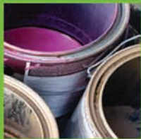
PINTURA Y SOLVENTES